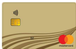
Mitglied ohne Karte