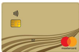
Vorhandene Karte bislang ohne Einsatz